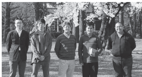
＝同期の神学生と共に＝